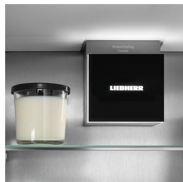
Osvětlení pro příjemnou atmosféru

Váš Liebherr je v kuchyni – ale pokud chcete, může být také kdykoli na internetu: Integrovaný SmartDeviceBox otevírá dveře všem výhodám Smart Home. Jednoduše zastrčte do zásuvky, zapněte a připojte svůj Liebherr k síti přes WLAN.