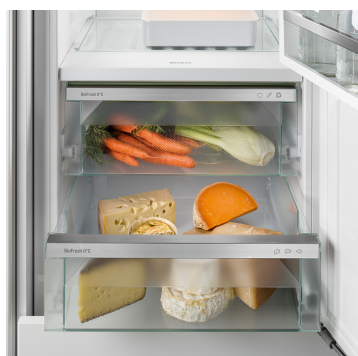
Přihrádka na maso a mléčné výrobky

Křupavý salát nebo jahody: Nejcitlivější potraviny si zaslouží zvláštní místo, aby zůstaly déle čerstvé: Přihrádky BioFresh. V přihrádce na ovoce a zeleninu se teplota blíží 0 °C. V kombinaci s vlhkostí vzduchu, která v této přihrádce převládá, a díky jejímu těsnému uzavření je zde nebalenému ovoci a zelenině obzvláště dobře. Nemusíte nic nastavovat.