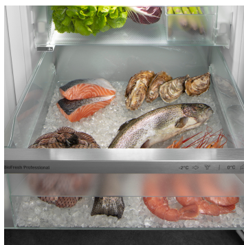
Přihrádka na ryby a mořské plody

Chtěli byste chladit ovoce a zeleninu jako profesionálové? HydroBreeze vás nadchne: Studená mlha v kombinaci s teplotou v přihrádce těsně nad 0 °C potraviny mimořádně povzbudí a jsou pak déle trvanlivé. A mlha vytváří vizuální wow efekt. HydroBreeze se aktivuje každých 90 minut na 4 sekundy a při otevření dveří na 8 sekund.