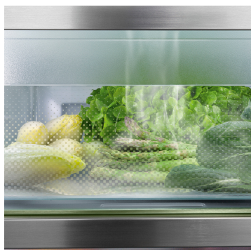
BioFresh s HydroBreeze

Chtěli byste chladit ovoce a zeleninu jako profesionálové? HydroBreeze vás nadchne: Studená mlha v kombinaci s teplotou v přihrádce těsně nad 0 °C potraviny mimořádně povzbudí a jsou pak déle trvanlivé. A mlha vytváří vizuální wow efekt. HydroBreeze se aktivuje každých 90 minut na 4 sekundy a při otevření dveří na 8 sekund.