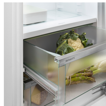
Přihrádka na ovoce a zeleninu

Milujete ryby? Ve vaší chladničce Liebherr zůstanou čerstvé! Neboť v přihrádce na ryby a mořské plody můžete tyto potraviny skladovat při optimální teplotě -2 °C stejně profesionálně jako u prodejce ryb. Velikost zóny s teplotou -2 °C můžete libovolně upravovat – a ve zbývajícím prostoru skladovat například maso a mléčné výrobky při optimální teplotě 0 °C. Ukazatel LED přitom indikuje, že je zóna -2 °C právě aktivní.